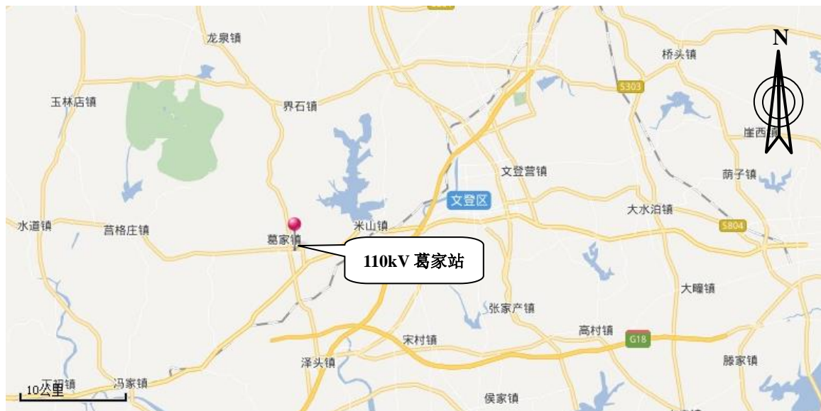
图 4-1 110kV 变电站地理位置示意图

110kV 葛家站位于文登市葛家镇岔河村西侧 40m、胜德路北 60m 处；变电站北侧和东侧为林地，西侧和南侧为空地，东侧 40m 处为岔河村民房。变电站地理位置示意图见图 4-1，变电站周围关系影像图见图 4-2，周围情况见图 4-3~图 4-6。