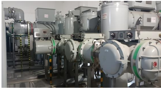
图 4-9 110kV GIS