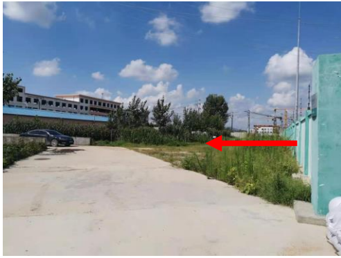
图 4-5 变电站南侧