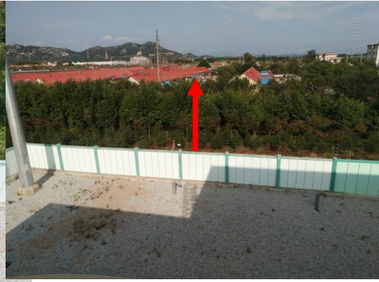
图 4-4 变电站东侧