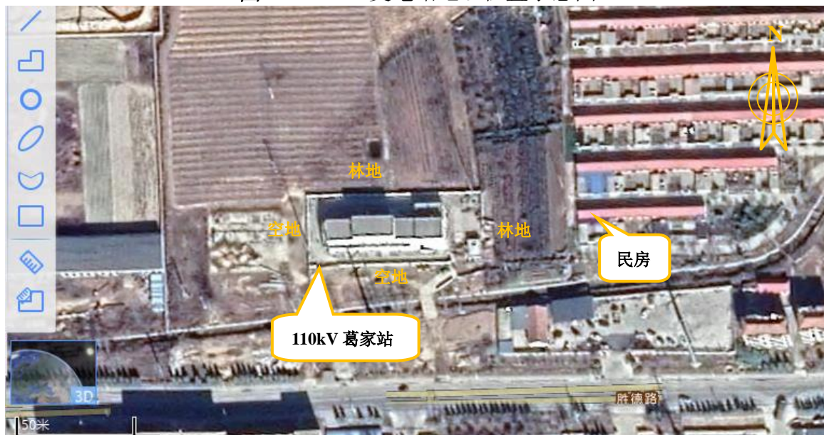
图 4-2 110kV 变电站周围关系影像图