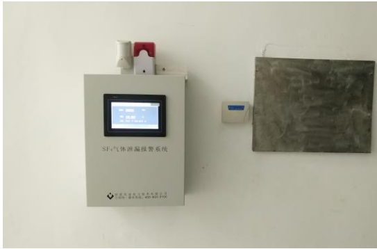
图6-3 SF 6 报警器