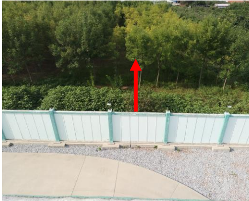
图 4-3 变电站北侧