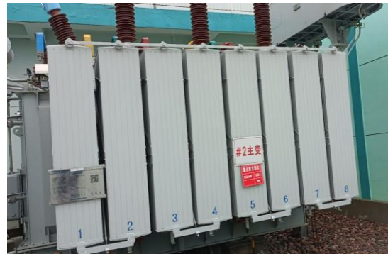
图 4-8 #2 主变压器