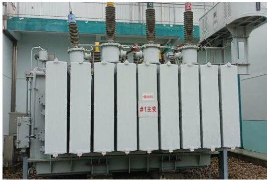
图 4-7 #1 主变压器