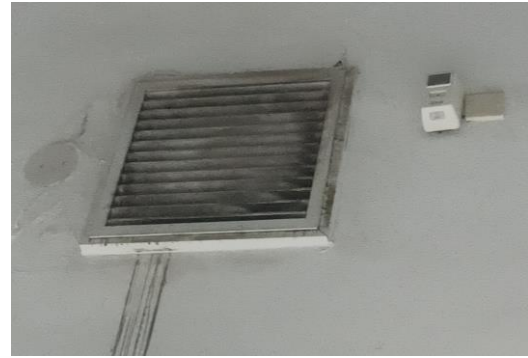
图6-4 110kV 配电装置室通风