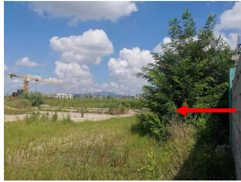
图 4-6 变电站西侧